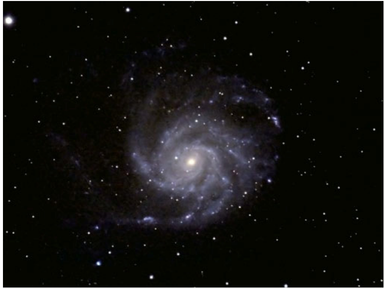
© Heinrich Forth / Wolfgang Schnalke / AVSO

Einen Augenprüfer stellt das Sternpaar Mizar und Alkor dar, welcher unter Landhimmel auf jeden Fall als Doppelstern erkannt werden kann. Dabei sind der Mittlere Deichselstern Mizar und sein Begleiter Alkor tatsächlich ca. drei Lichtjahre voneinander entfernt und unterliegen keiner gegenseitigen gravitativen Verbindung. Vielmehr sind die beiden Sterne für sich gesehen echte Mehrfachsysteme. Mizar kann bereits in kleineren Teleskopen als Doppelstern aufgelöst werden, wobei die Komponenten A und B wiederum Doppelsterne sind. Allerdings konnten die beiden Doppelsterne noch nicht visuell getrennt werden. Von ihrer Existenz weiß man nur durch spektroskopische Untersuchungen. Der arabische Name Mizar bedeutet "Gürtel".