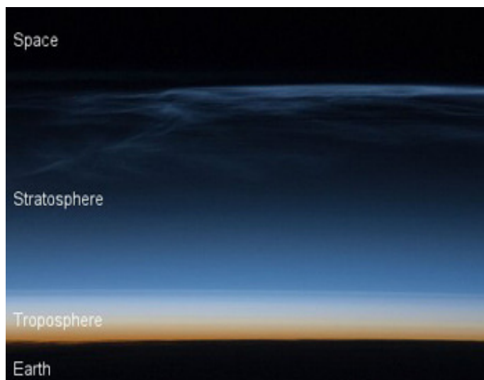
NLCs aufgenommen von der ISS

Was also macht ein verzweifelter Astronom? Er sucht nach nachleuchtenden Wolken: